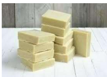
FIGURA 4 - OBJETO TRANSFORMADO