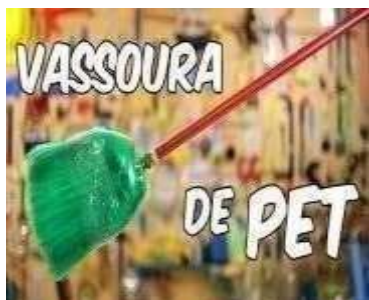
FIGURA 2 - OBJETO TRANSFORMADO