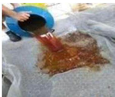
FIGURA 3 - MATERIAL PARA A RECICLAGEM