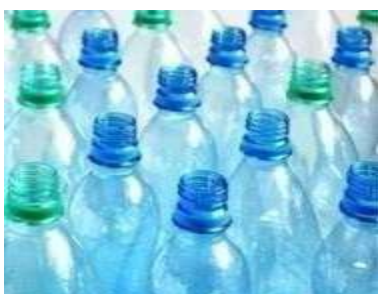
FIGURA 1 - DO MATERIAL PARA RESICLAGEM