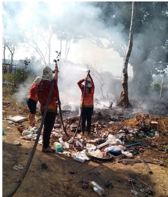
Fig. 09: Ação de Brigadistas em combate a queimadas em lixeiras viciadas.