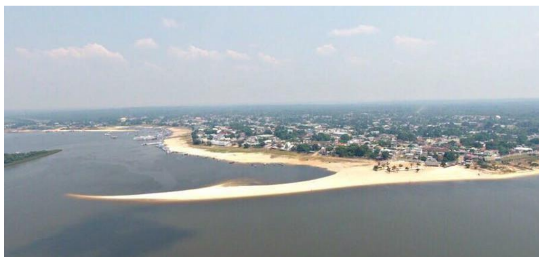
Fig 03: Vista da Praia da Ponta da Maresia – Principal referencia turística de Maués.