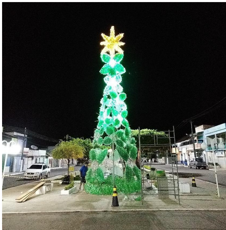
Fig. 12: Árvore de Natal Sustentável – 9m de altura.

Os pontos aqui contextualizados, estão ressaltados em normas e legislações postas e apoiados em literaturas consultadas. Neste perfil, a Política Municipal de Resíduos Sólidos corresponde às legislações de âmbito federal, estadual e municipal, convergindo sempre para a melhoria e sadia qualidade de vida dos munícipes, ao ordenamento ambiental e a efetivação do saneamento local, de acordo com o descrito a seguir: