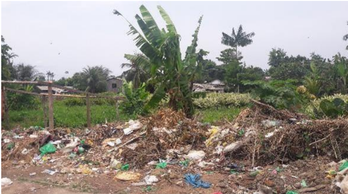
Fig. 06: Vazadouro ao longo do Bairro Ramalho Júnior