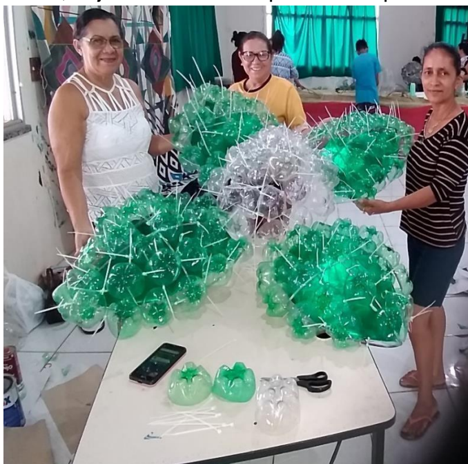
Fig. 11: Oficina de Capacitação para confecção de artefatos decorativos de garrafas PET

Como difusão da economia circular e criativa, transferência de conhecimento e de inclusão social, a SEDEMA desenvolve junto à comunidade, oficinas de fabricação de sabão à partir do óleo de fritura descartado e a Secretaria de Cultura e Turismo – SECTUR, oportuniza a comercialização de produtos sustentáveis por meio da realização da Feira de Artesanato e Gastronomia, que acontece a cada 15 dias na cidade, permitindo a comercialização de produtos, objetos e utensílios produzidos pelos artesãos.