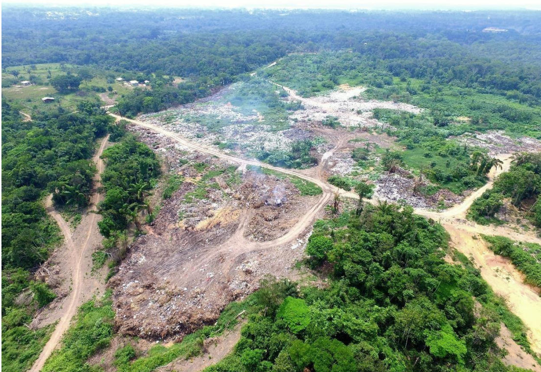
Fig. 10: Vista aérea da Lixeira pública (Drone)

A coleta dos resíduos domiciliares em Maués, é executada pela própria Prefeitura por meio da Secretaria Municipal de Obras e Serviços Públicos – SEMOSP, com frequência diária nos bairros centrais e alternada nos bairros periféricos. Neste rol, inclui-se a limpeza (capina, roçagem e varrição) de vias e da região de toda a área de orla, contemplando a zona de balneabilidade e a zona de atracação de embarcações advindas da zona rural e das comunidade ribeirinhas, que depositam seus restos ao longo da orla, indiscriminadamente. Além da coleta domiciliar, periodicamente, é feita a Campanha do Entulho, que coleta toda a sorte de resíduos resultantes da limpeza dos quintais e das lixeiras viciadas, realizada com apoio de garis, uma caçamba 13m 3 e uma pá mecânica. Dentre os materiais mais volumosos encontrados durante estas operações, estão restos de móveis, colchões, eletrodomésticos, restos de utensílios domésticos, vidros e pneus. Este material é todo transportado para a lixeira pública (Fig.10), sem a devida separação seletiva.