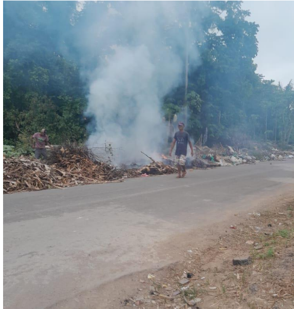
Fig. 08: Vazadouro em início de queimada, ao longo da Estrada João Bota.