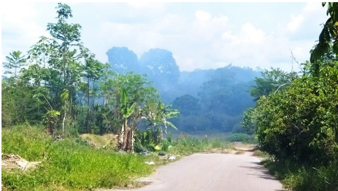
Fig. 07: Vazadouro ao longo do Bairro da Horta.