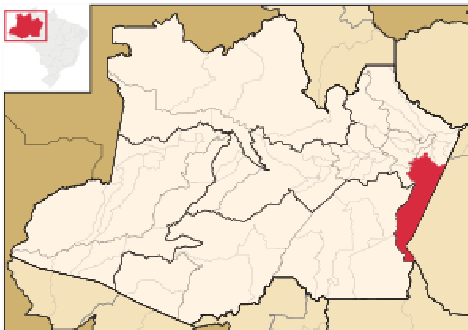
Fig. 01: Localização do município de Maués.

Segundo o IBGE, a população estimada é de 66.159hab (2021). Possui um IDHM de 0,588 (PNUD/2010) e o PIB da cidade é de cerca de R$ 541,7 milhões de, sendo que 57,2% do valor adicionado advém da administração pública, na sequência aparecem as participações dos serviços (24%), da agropecuária (57,2%) e da indústria (7,2%). A economia local é apoiada na cultura do guaraná, açaí, agricultura de subsistência, pecuária, manejo florestal madeireiro e não madeireiro, pesca, produção de farinha e atrativos turísticos (praias, paisagens cênicas, ampla cultura regional e eventos).