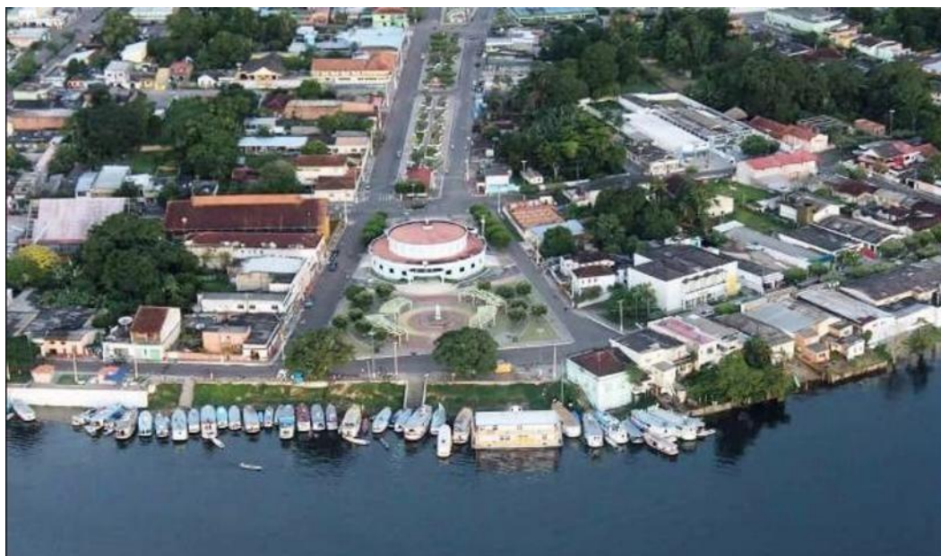
Fig 02: Vista frontal da frente da cidade – Bairro Centro

Considerando o comportamento dos aglomerados urbanos versus o consumo e descarte de inservíveis, Maués está enquadrada neste cenário, como produtora de resíduos na média das pequenas cidades brasileiras (Atlas de Destinação Final de Resíduos Sólidos – ABETRE/2022 – SINIR/MMA). Desta forma, alguns diagnósticos já realizados no município, revelam o crescimento populacional exponencial (Quadro 1) e, conseqüentemente, a exigência por produtos de consumo acompanharão este crescimento.