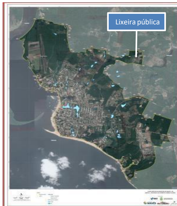
Fig. 04: Mapa do limite de perímetro urbano da cidade de Maués

Em consonância ao crescimento populacional, a cidade passa por um processo de modernização e adequação da paisagem desde 2018, trazendo requalificação ambiental e urbanística, com a implantação do Programa de Saneamento Ambiental Integrado - PROSAI/Maués. Programa financiado pelo Banco Interamericano de Desenvolvimento – BID em parceria com o Governo do Estado do Amazonas. Dentre as modificações, o Plano Diretor Participativo de Maués e o Plano de Gerenciamento de Resíduos Sólidos, trouxeram contribuições significativas, norteados o planejamento para melhoria da gestão municipal. (Fig. 04 e 05).